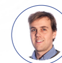
—Willem De Bock

De meeste verzekeraars dekken personen die handelingen als bestuurder verrichten. Het is echter opletten geblagen wanneer een groepering van vennootschappen verzekerd moet worden. In dat geval is het nog cruciaal dat de polis correct is opgesteld, zodat elke bestuurder in de groep dekking geniet. De rechtsbijstandsgarantie is wellicht de belangrijkste waarborg in de bestuurdersaansprakelijkheidsverzekering, aangezien de kosten van verdediging in een rechtszaak rond bestuurdersfouten zeer hoog kunnen oplopen. De verzekeraar zal die dragen binnen de overeengekomen limiet in het verzekeringscontract.